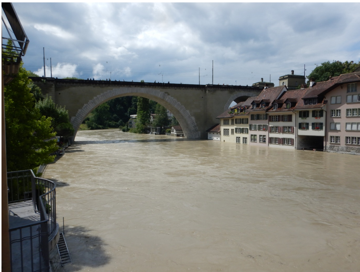
Hochwasser 2021 an der Aare in Bern.

Zunahme der Spitzenabflüsse das Schadenausmass kaum bis wesentlich mehr gegenüber der Siedlungsentwicklung zunehmen kann.