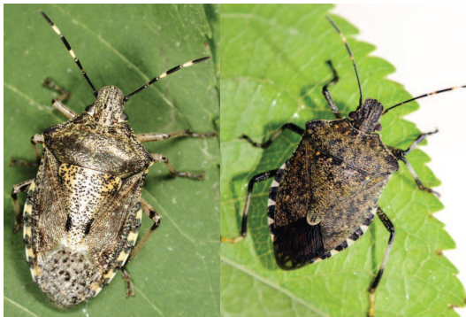
Figure 1 Raphigaster nebulosa (à gauche) © M. Münch Halyomorpha halys (à droite) © Inra / J. streito