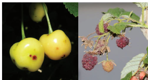
Figure 6 Dégâts des piqûres sur cerises (à gauche), framboises (à droite) et défor- mations sur poires (en bas)