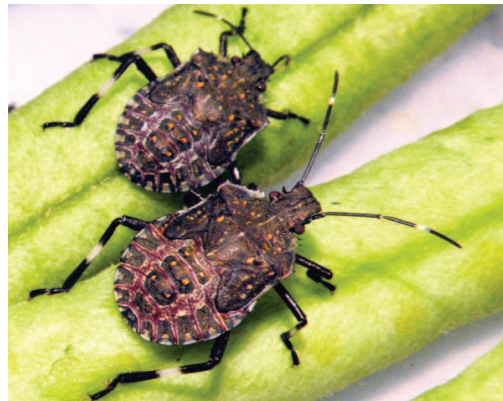
Figure 5 Larves (stade L5) de H. halys