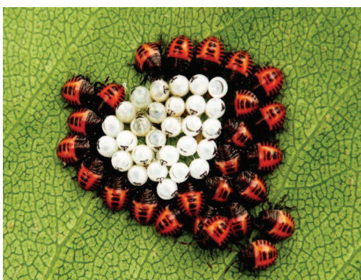
Figure 4 Oeufs et larves (stade L1) de H. halys