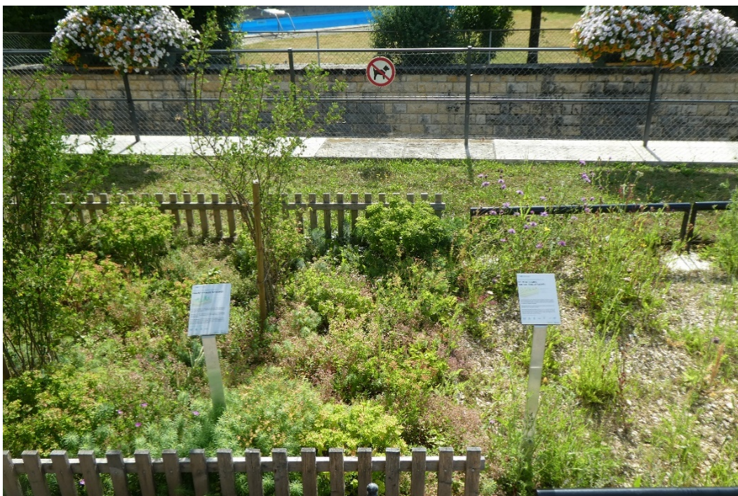
Extrait des planches d'essais avec à gauche une surface plantée, à droite un semis sur sol maigre et en arrière plan les décorations florales traditionnelles

Dans le cadre de la mise en oeuvre du plan directeur, plusieurs essais de végétalisation ont été réalisés sur deux espaces publics au centre de la ville de Porrentruy. Ces tests avaient pour objectif d'observer le développement de la flore sur des sols de différente qualité, afin de sélectionner le revêtement végétal idéal pour les espaces publics grâce à des connaissances concrètes. Ils ont également permis de comparer les coûts financiers des différentes plantations, ainsi que de quantifier les efforts d'entretien et l'apport en eau nécessaires. Des panneaux informatifs ont sensibilisé la population à ces démarches.